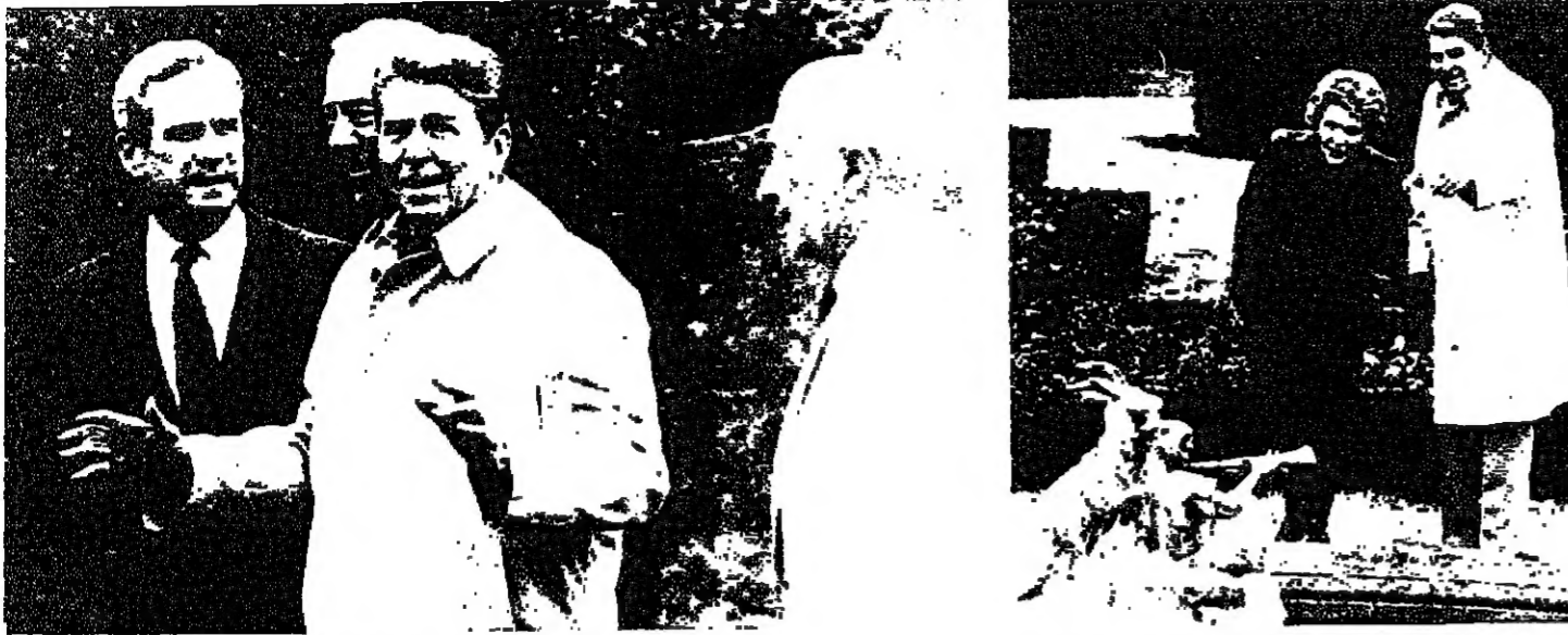
الرئيس ريغان مع مطاران وشولتز ودونالد ريغان

الاسد استقبل ولايتي الاحتفالات تغم سورياً في ذكرى الحركة التصحيحية وقلت الوكالة الأمريكية قد نشرت رسالة بحث فيها واينبرغر الرئيس ريغان على ان يفرض التحدي باحترام اتفاقية سالس 2 بعد انتهائها نهاية كانون الاول المقبل. وعدم اعطاء اي تأكيدات لغورباشيوف بشأن استمرار التزام الولايات المتحدة بمعاهدة ايه بي إم - 5 في اطار التفسير الضيق لهذه المعاهدة لأن ذلك قد يؤدي الى تفاقم برنامج حرب الكوكب.